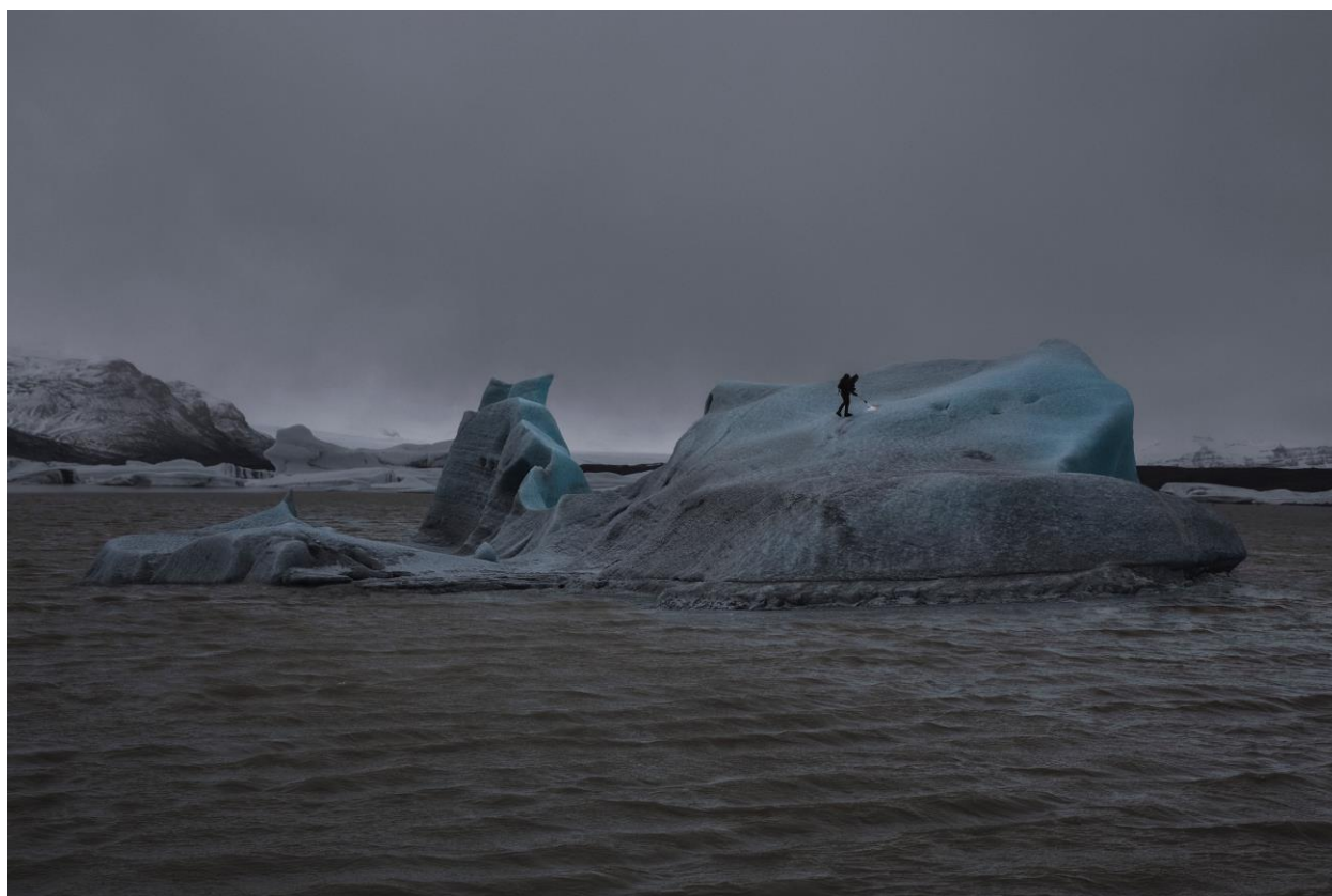
Julian CHARRIÈRE, The Blue Fossil Entropic Stories , 2013, photographie, 100 x 150 centimètres, pièce unique.

impossible de prévoir leur évolution, car ils articulent des strates de temps multiples et des forces différentes : aucun glacier ne se comporte ni n'évolue vraiment comme un autre (Chamberly and Alean 73). Aujourd'hui, presque 10 % de la surface de la terre est couverte de glaciers, pourcentage constamment menacé par la hausse des températures. Face au défi que le réchauffement climatique pose donc à nos manières de représenter et de penser la Terre, Julian Charrière choisit comme point de départ un lieu-clé, une entité cruciale dans le débat sur la crise climatique. D'une part, les glaciers sont les formations géologiques sur lesquelles les effets du réchauffement climatique sont le plus rapidement visibles. De l'autre, l'océan Arctique, où se situe le glacier en question, va devenir un nouveau « paradis » pour l'exploitation des combustibles fossiles, à l'initiative de géants pétroliers comme Shell — une preuve de la persistance d'une conception de la nature comme ressource infinie. En travaillant sur place, l'artiste évoque a contrario son sentiment de se trouver dans une sorte de cimetière : « C'était une expérience bizarre, être entouré de ces glaciers mourants, en train de fondre 4 . » (Kobialka 103)