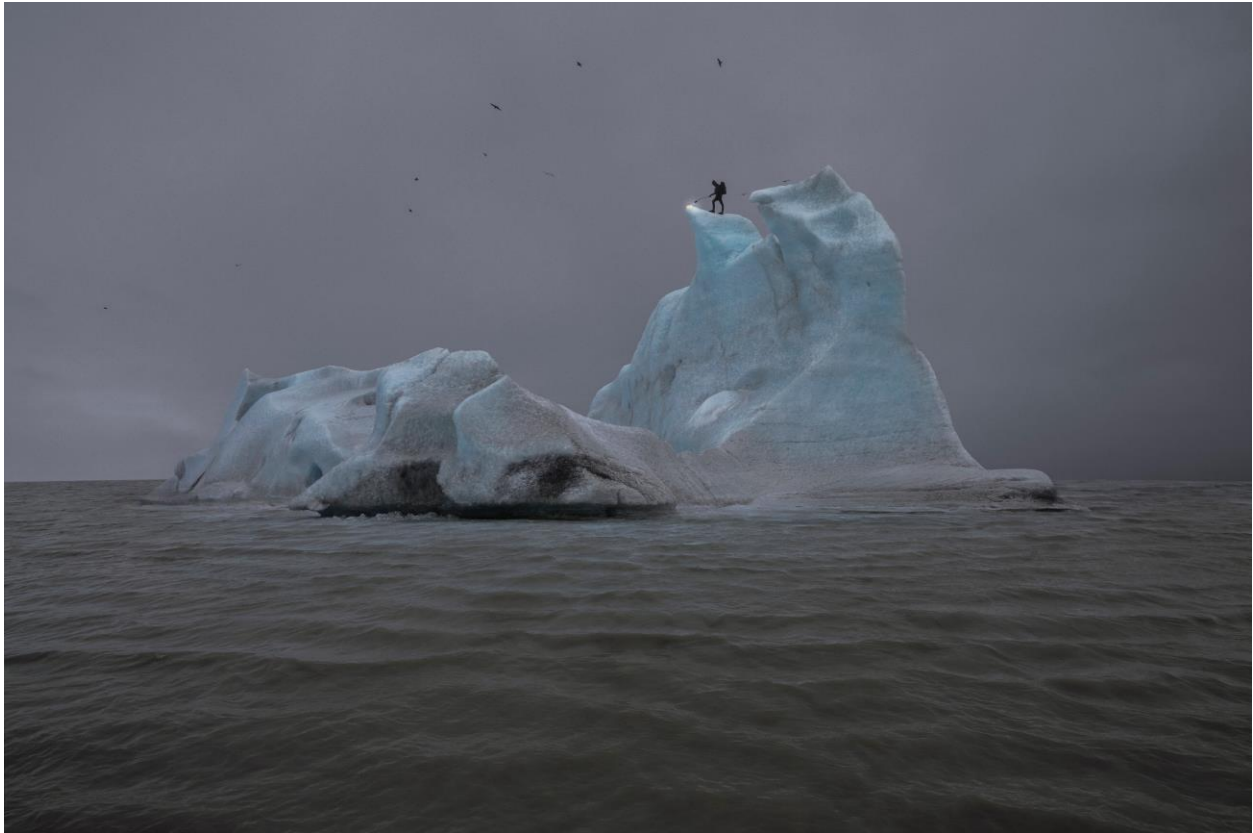
Julian CHARRIÈRE, The Blue Fossil Entropic Stories , 2013, photographie, 100 x 150 centimètres, pièce unique.

En 2013, l'artiste franco-suisse Julian Charrière (1987, basé à Berlin) s'est rendu sur un glacier islandais pour en faire fondre la surface. Cet acte de destruction futile, documenté par une série de photographies, questionne — et représente — le rapport de l'homme à la nature à l'heure de l'Anthropocène.